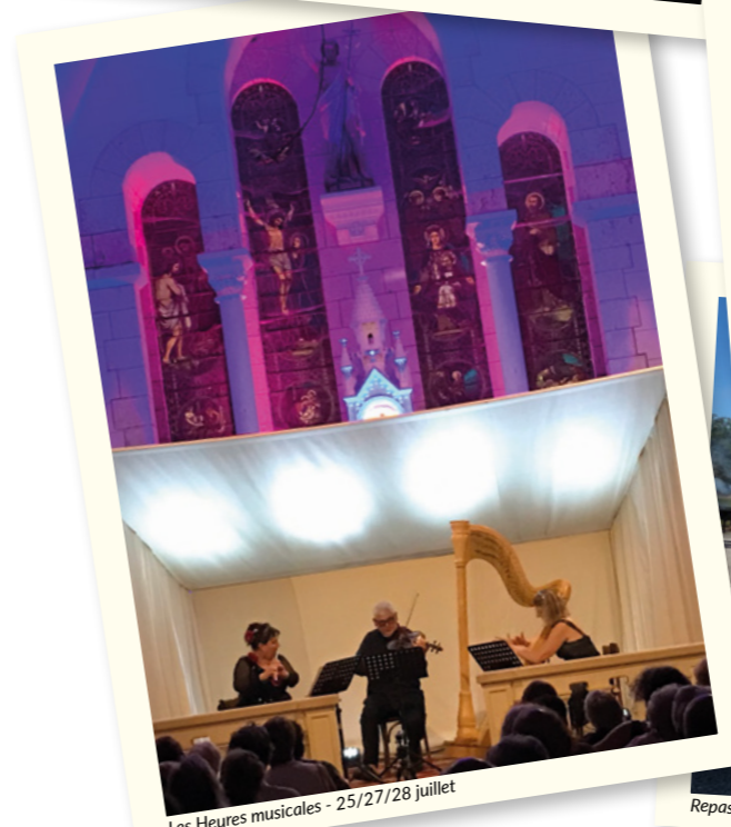
Les Heures musicales - 25/27/28 juillet