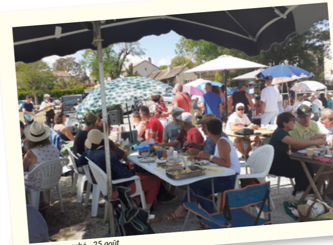
Repas du marché - 25 août

Un grand merci aux associations qui ont organisé tous ces évènements.