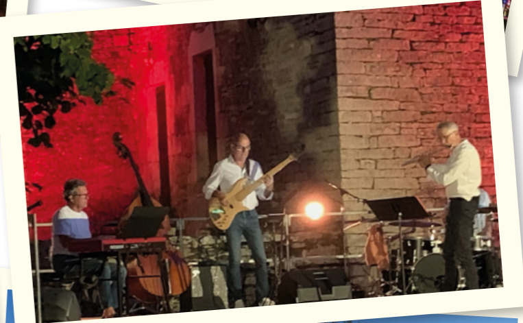
Jazz - 22 août