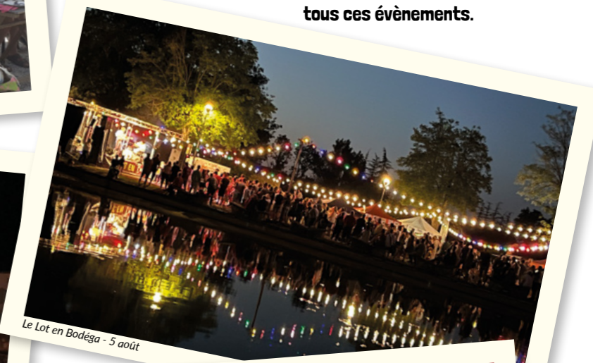
Le Lot en Bodega - 5 août