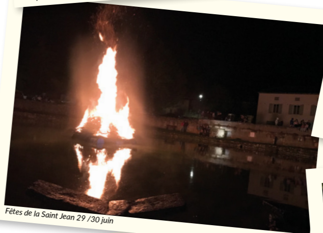
Fêtes de la Saint Jean 29 /30 juin