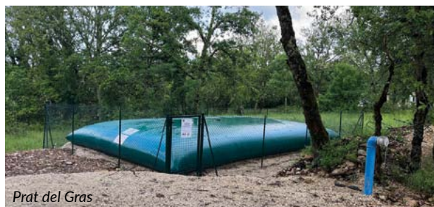
Prat del Gras

A côté de la bâche à eau située au lieu-dit Prat del Gras (chemin de Brunard) un espace propre est en cours d'aménagement et les containers qui y seront bientôt installés seront destinés aux habitants de ce quartier.