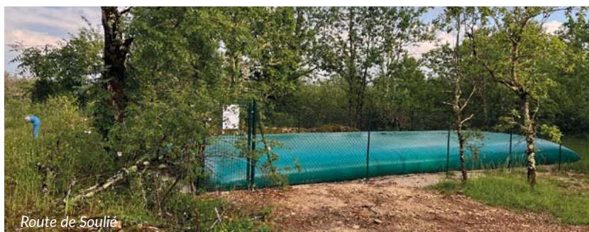
Route de Soulié